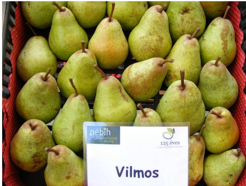
Vilmos körte

Fája közepes növekedési erélyű, kezdetben felfele törő, később szétterülő koronájú. Termőhelyre kevésbé igényes, jól alkalmazkodó fajta. Porzói: Clapp kedveltje, Bosc kobak, Nemes Krasszán.