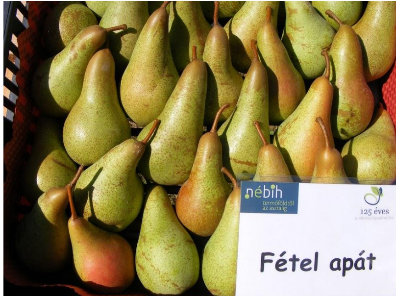
Fétel apát körte

14,5 Brix-fokot is elér. Héja vékony zöldessárga. Meszes talajokon csak saját gyökéren, vagy mésztűrő alanyokon termesztendő! Nem könnyű a termesztése, alternanciára hajlamos!