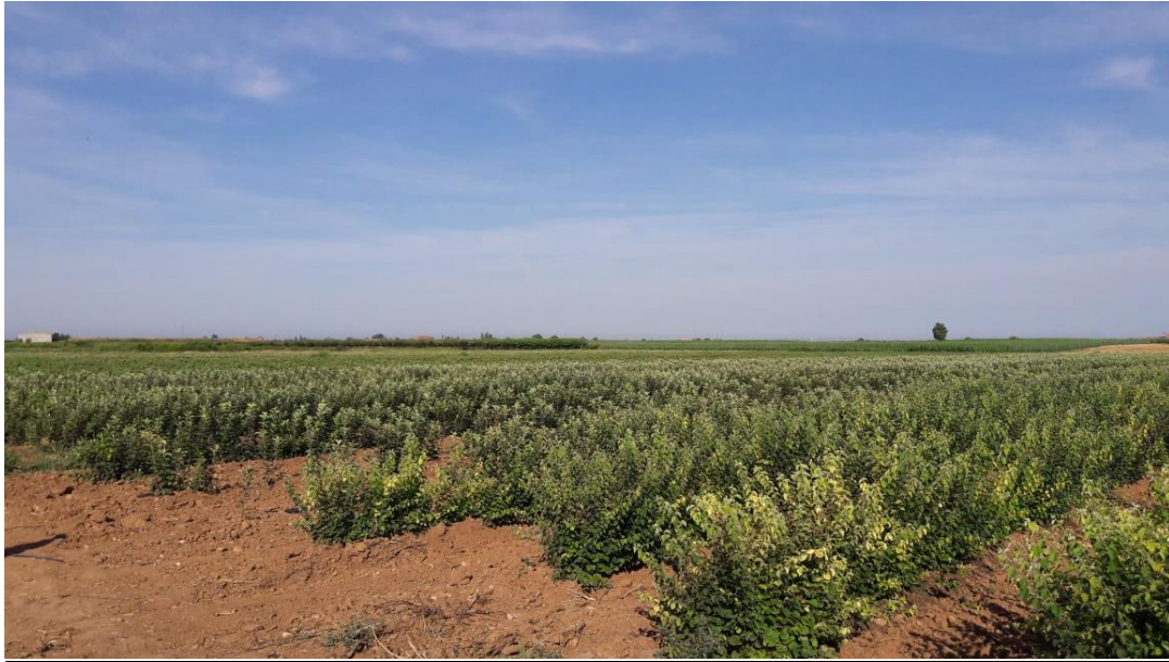
BA-29 birs anyatelep, Spanyolországban

Gyümölcs szaporítóanyag nagykereskedelmi eng. szám: 78/2005 Növény egészségügyi reg. szám: HU 1321406174