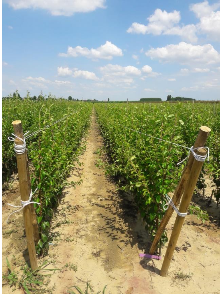
Körte oltványok BA-29 alanyon a Battistini faiskola Bolognai telepén

Gyümölcs szaporítóanyag nagykereskedelmi eng. szám: 78/2005 Növény egészségügyi reg. szám: HU 1321406174