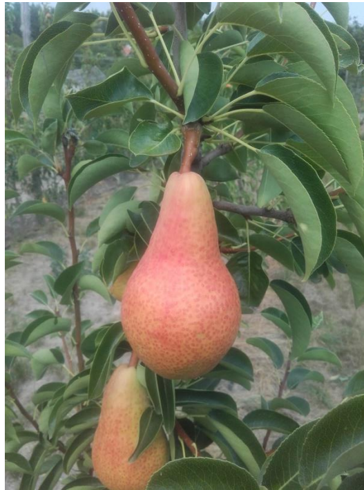
Carmen R

Gyümölcs szaporítóanyag nagykereskedelmi eng. szám: 78/2005 Növény egészségügyi reg. szám: HU 1321406174